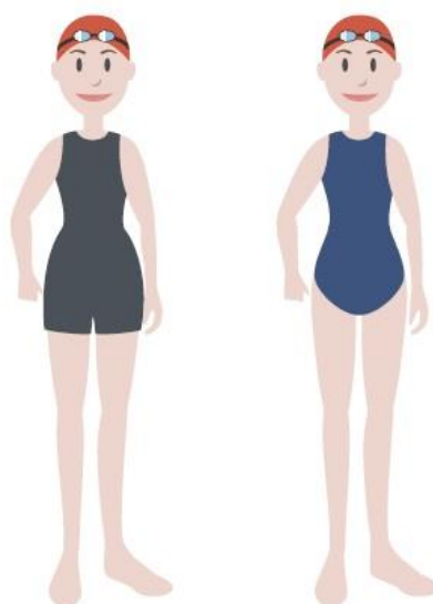
Figura 2 – Equipamentos de competição para as nadadoras infantis.